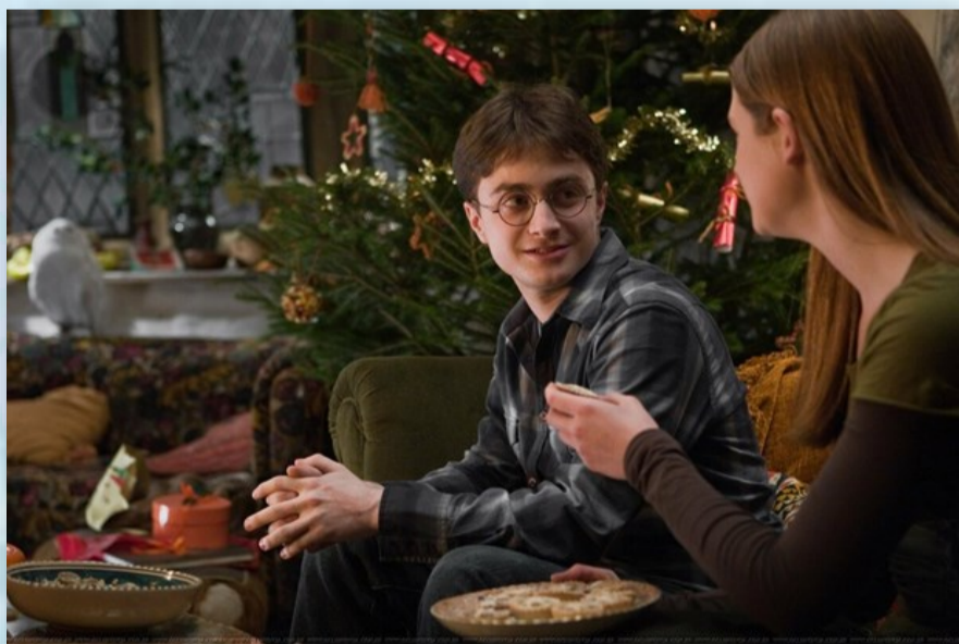
Кадр из фильма «Гарри Поттер и Принц-полукровка»